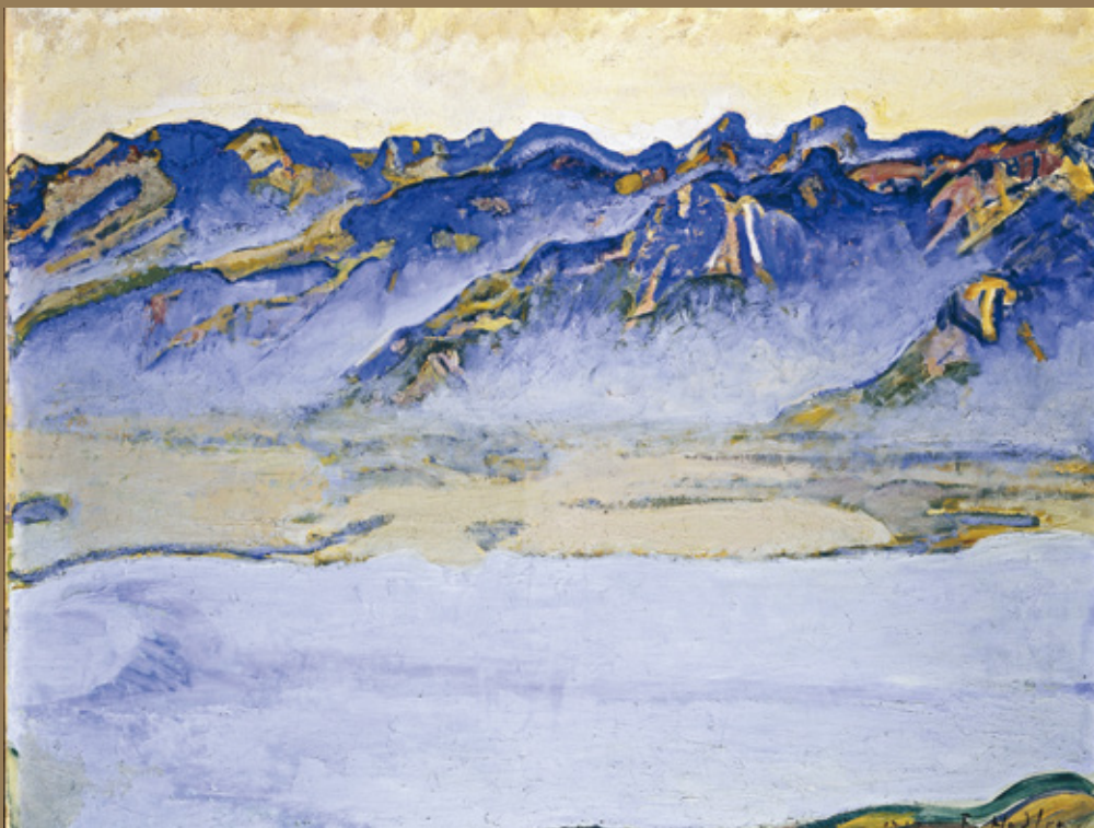
Ferdinand Hodler La montée des brouillards sur les Alpes Savoyardes, 1917, Huile sur toile

Vingt minutes, une œuvre : les concerts ayant lieu au MAH sont précédés par une présentation d'une œuvre de Ferdinand Hodler en lien avec la thématique du concert.