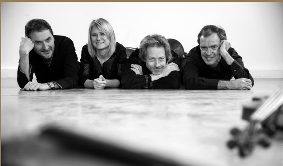
Quatuor de Genève